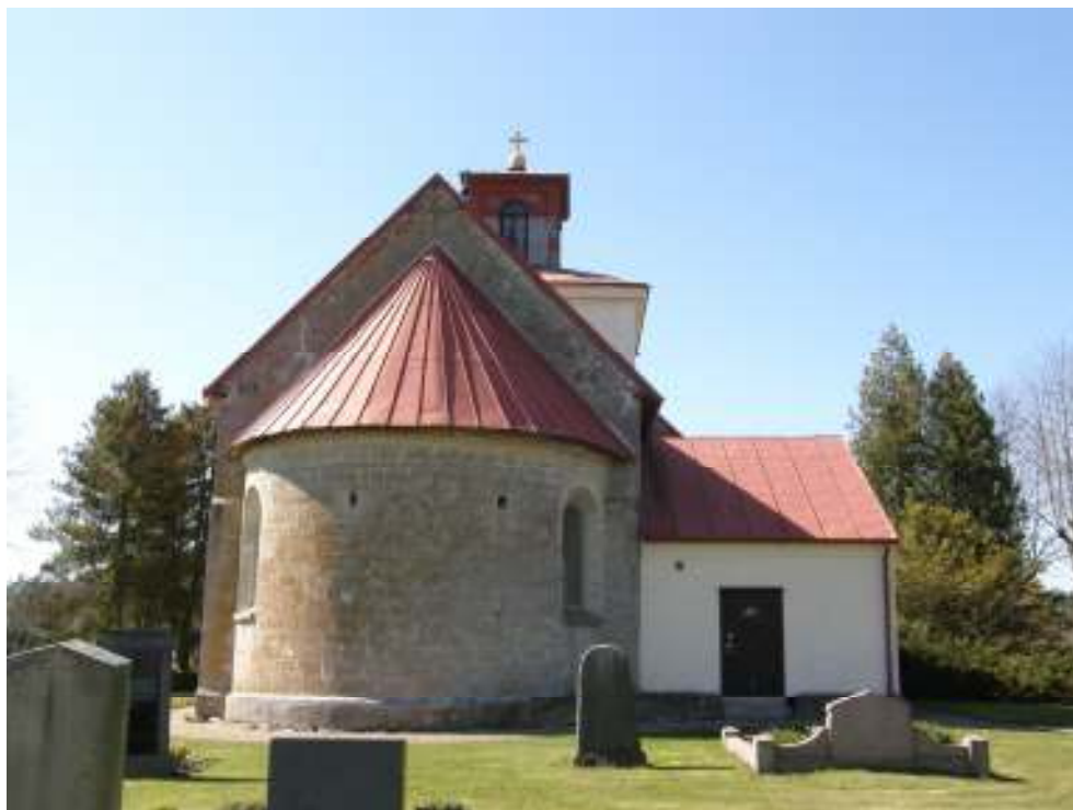
Absid och sakristians takfall från ost/öster.