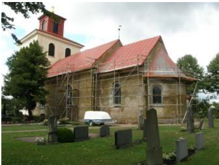
Övre raden. T v: Norra Strö kyrka efter att taken vattenblästrats, från nordost. Tornets tak, lanterninen och korset har fått sin slutstrykning. T h: Vapenbusets äldre enkelfalsade plåttak, mot väst, efter vattenblästring (plåten längst t v?). Undre raden. T v: Långhusets södra takfotstass T h: Långhusets plåttak efter blästring. Samtliga plåtar har penselstrukits längs med kanterna, före det att plåtarna sprutmålats. Norra fasaden. Stora bilden: kyrkan från sydost. Tornarbetena avslutade och samtliga övriga tak vattenblästrade.