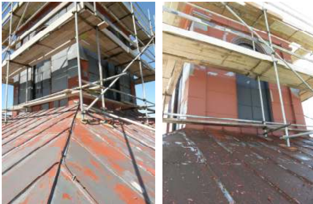
Lanterninen efter vattenblästring. (22/5)