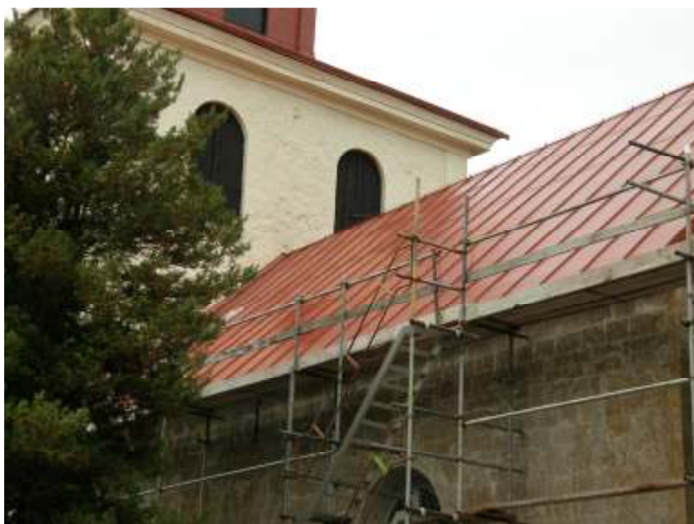
Södra takfallet oktober 2008.