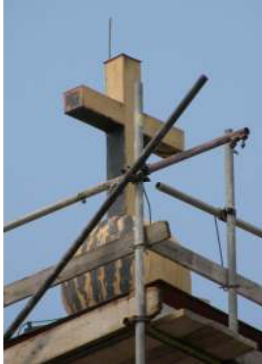
T v: Lanternintaket har en alltför matta yta 6/9 T h: Tornkorset efter att det vattenblästrats. 22/5