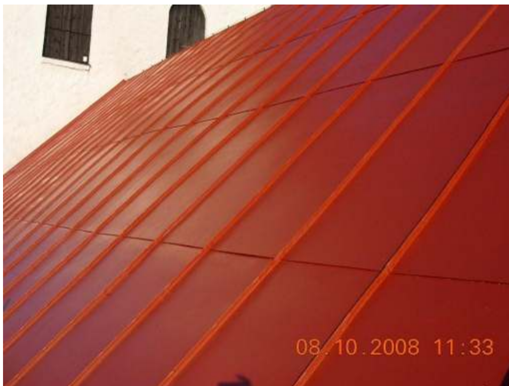
Södra takfallet i oktober 2008