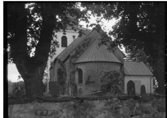
T v: Kyrkan från sydost, så som den såg ut 1907 (RAÄ). T h: Kyrkan från öster. Foto: Erik Lundberg, 1942. Bilden är beskuren.