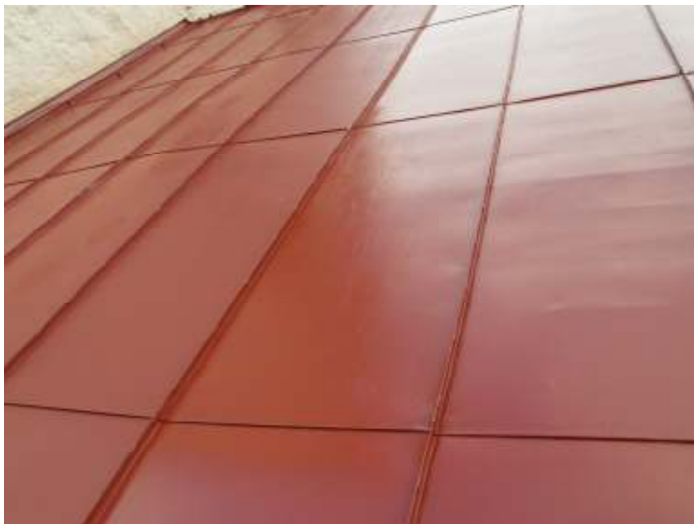
Södra takfallet oktober 2008.