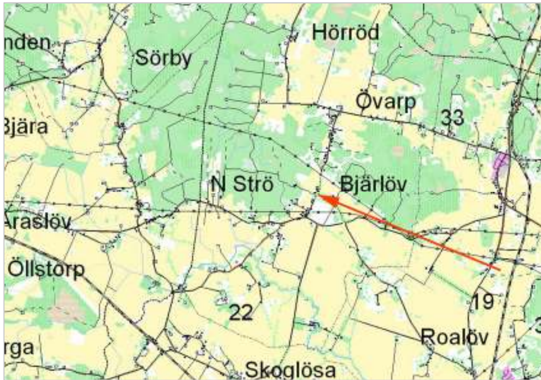
Del av Araslövs församling. Norra Strö kyrka utmärkt med pil.