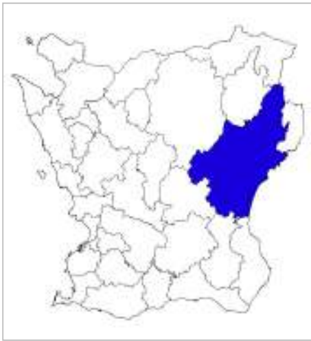
Skånekartan med Kristianstad kommun markerad.